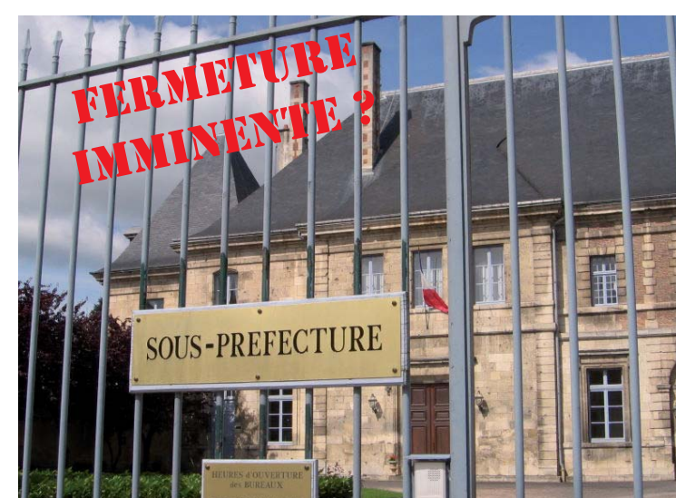
Verdun va-t-elle suivre le même sort ?