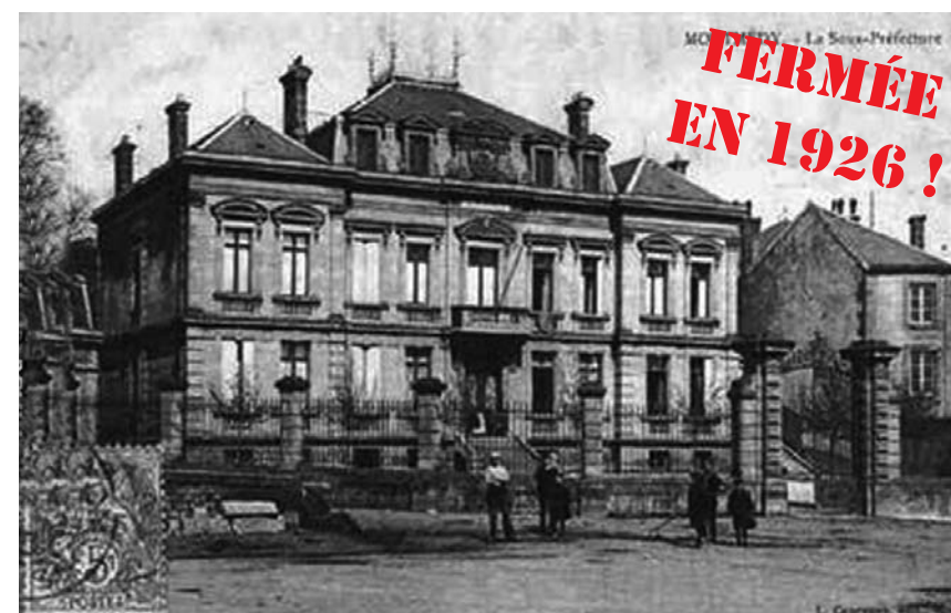
Montmédy : fermée en 1926 avec 105 autres sous-préfectures