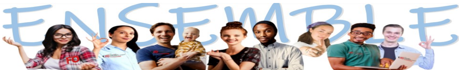
PERSONNELS ADMINISTRATIFS, TECHNIQUES, de la FILIERE SOCIALE DES PREFECTURES, SOUS-PREFECTURES, SGCD et SGAMI

Notre syndicat attend un engagement de votre part !